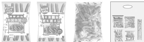
オキハムポキポキ ウィナー510g オキハムポキポキ ウィナー540g オキハムポキポキ ウィナー1kg 春ポキお楽しみ袋 (※数量限定販売)