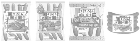
オキハムポキポキ ウィナー205g オキハムポキポキ チーズ入り180g オキハムポキポキ プレミアム140g オキハムポキポキ ロングウィナー175g